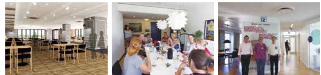
【北欧式介護の現地研修 2016年9月撮影】